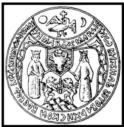
Foto nr. 4. Sigiliul lui Mihai Viteazul,

A DOUA UNIRE politică din Istoria Romanilor , de data asta „ de jure și de facto ”, a celor trei principate românești, și PRIMA UNIRE sub sceptrul unui domnitor român , a avut loc „ manu militari ” la 27 mai 1600.