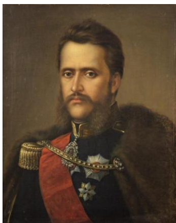
Foto Nr. 1, Alexandru Ioan I.

Din punct de vedere istoric așa este, însă dacă respectăm ordinea numerală strictă a Unirilor Românilor , „de jure” sau „de jure” și „de facto”, atunci Unirea Principatelor Române din 24 Ianuarie 1859, este a Treia Unire .